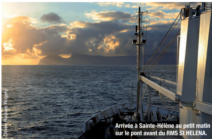
Arrivée à Sainte-Hélène au petit matin sur le pont avant du RMS St HELENA.