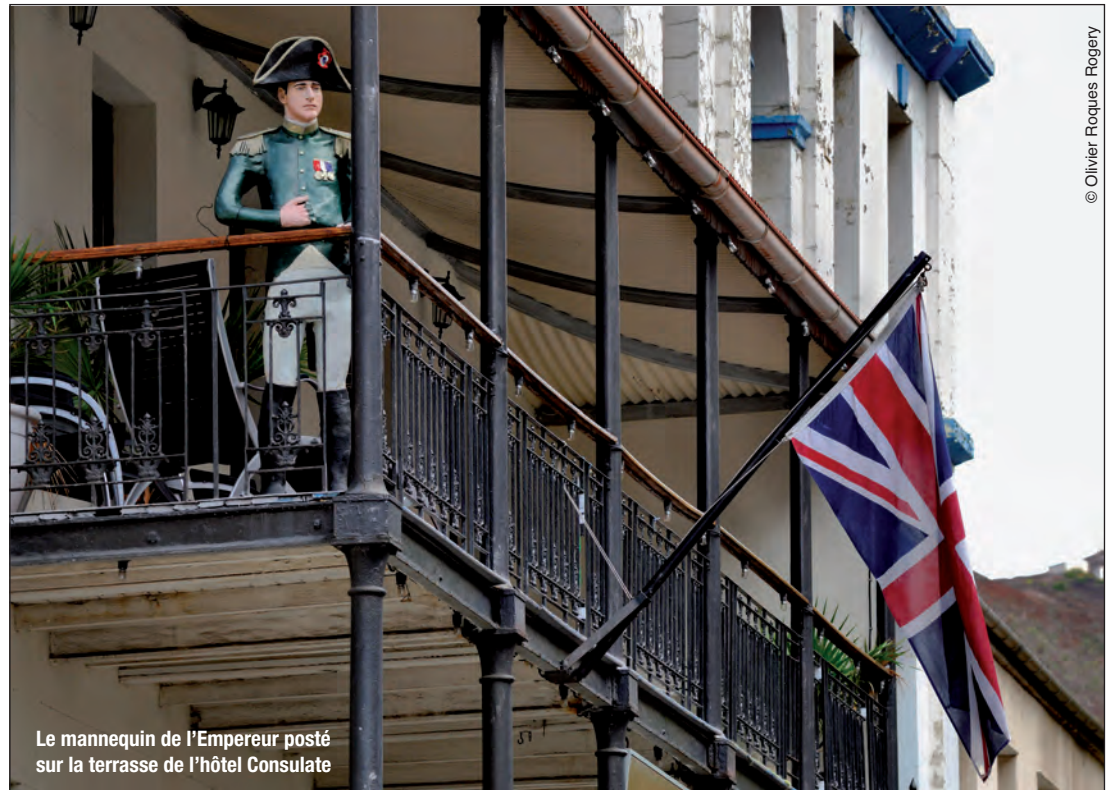
Le mannequin de l'Empereur posté sur la terrasse de l'hôtel Consulate

Ces confidences sont mises en regard avec des photographies d'Olivier Roques Rogery prises lors d'un reportage effectué en 2014 pour Le Figaro magazine . Attiré «par tout ce qui est hors-normes, qu'il s'agisse des gens, des lieux ou des choses», le photographe rêvait depuis un certain temps déjà de se rendre à Sainte-Hélène. «Surtout, dit-il, après avoir lu l'ouvrage de Philippe Kauffmann, La chambre noire de Longwood ». Après six jours de mer, il découvre la côte «sinistre, semblable à un sarcophage de pierre» puis l'incroyable diversité des paysages de l'île «par endroits volcaniques, lunaires, et à d'autres luxuriants, verdoyants». Il constate aussi que le souvenir de Napoléon