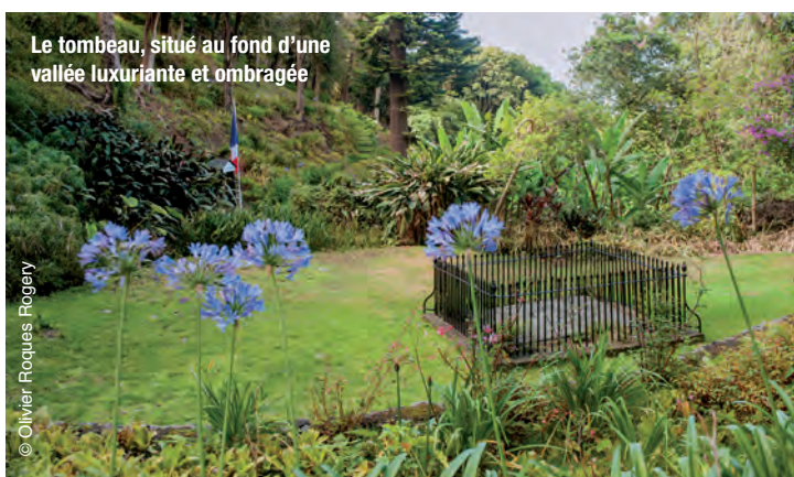
Le tombeau, situé au fond d'une vallée luxuriante et ombragée