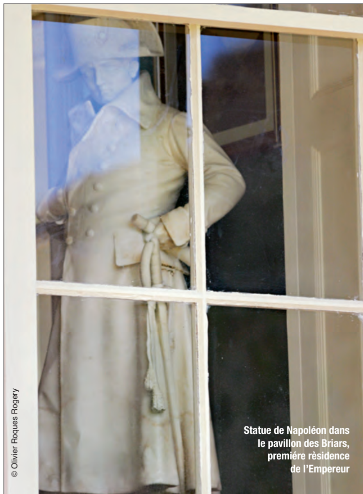
Statue de Napoléon dans le pavillon des Briars, première résidence de l'Empereur